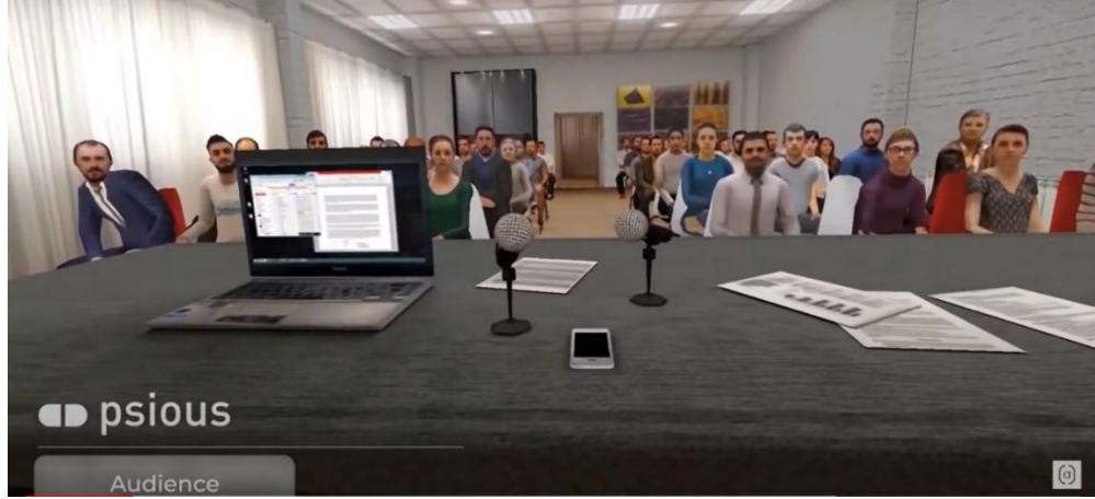
Şekil.1 _Audience Sanal Ortamı