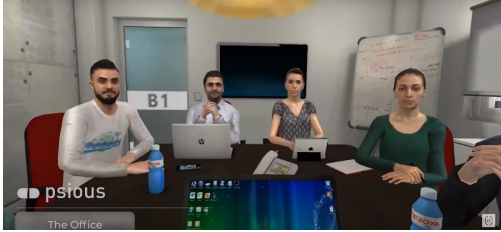
Şekil 2. Office Sanal Ortamı