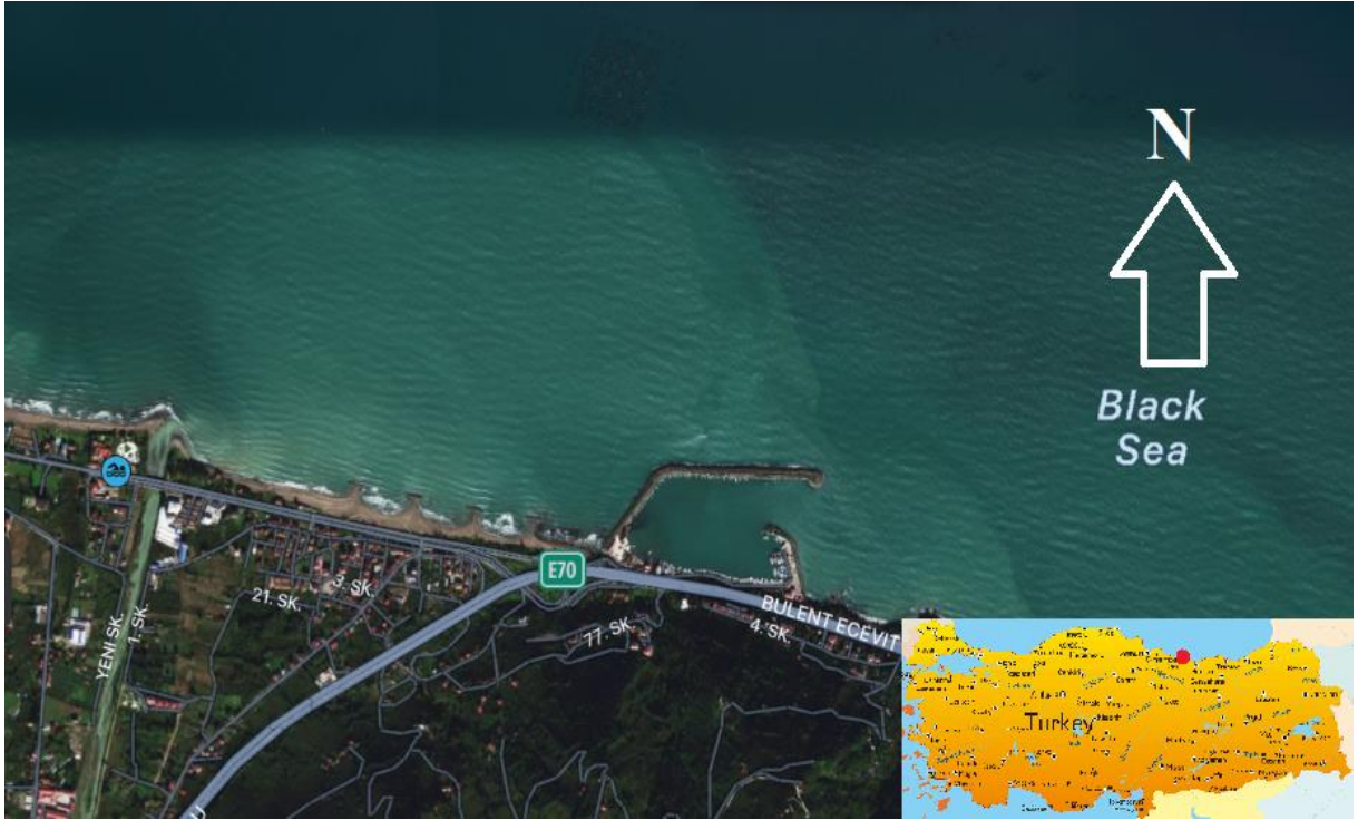
Şekil 1. Çalışma Sahası

Çalışma yeri 41.019087-37.841070 koordinatlarında, Karadeniz sahilinde bulunan Ordu-Efirli Balıkçı barınağıdır. Söz konusu yerde yeterince uzunlukta bir mendirek bulunmakta olup kıyı kumsal olduğundan oyulmaya ve yığılmaya müsait bir sahadır. Çalışma sahasının uydu görüntüsü Şekil 1’de verilmiştir (Google Earth).